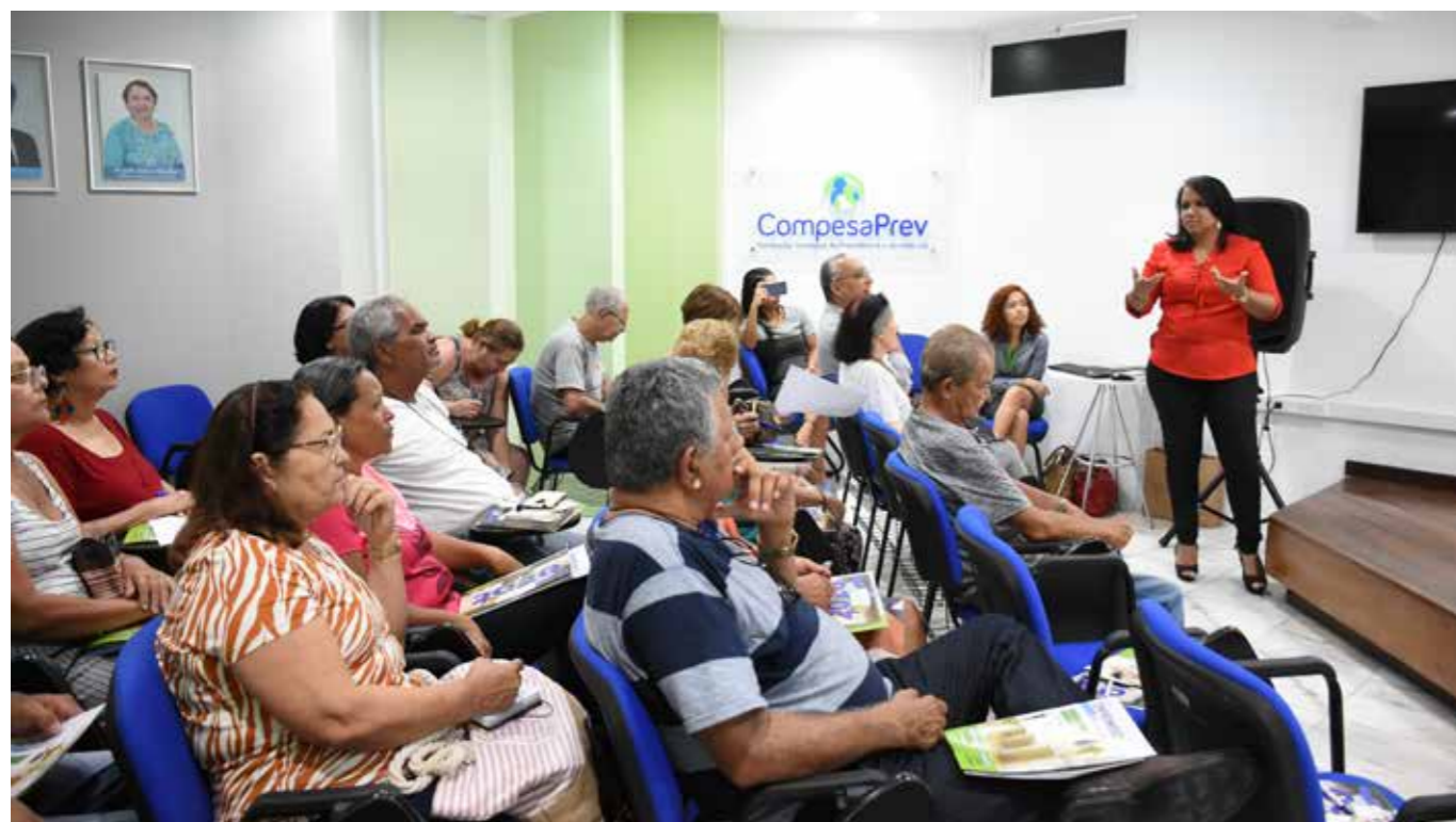
A reeducação financeira foi tema de palestra oferecida pela CompesaPrev no Dia do Aposentado

O crescimento da inadimplência entre pessoas de 60 anos ou mais acende alerta sobre a necessidade de repensar as finanças nessa fase da vida