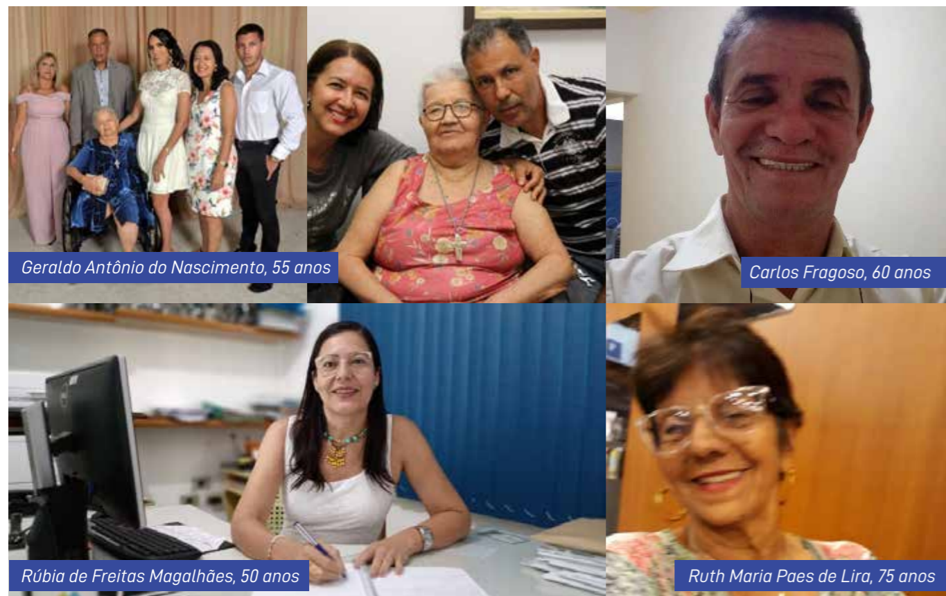
Associados fazem auto-avaliação sobre curva da felicidade

Máxima ganhou força com pesquisa que afirma existir uma "curva de felicidade"